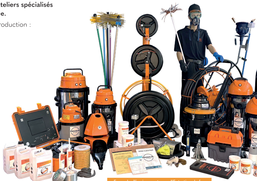
Exemple d'équipement pour l'Entretien du feu

Cette intégration permet à l'entreprise d'offrir des produits fiables, durables et adaptés aux besoins du terrain.